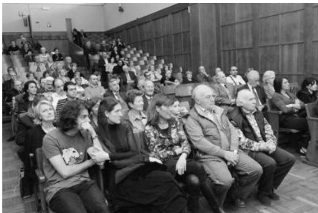
Il pubblico che ha seguito la cerimonia di premiazione del concorso "Lodifacera" all'interno dell'aula magna del Verri

SI SONO SVOLTE VENERDÌ LE PREMIAZIONI DEL CONCORSO NAZIONALE NEL CONTESTO DELLA RASSEGNA SULL'AUTUNNO